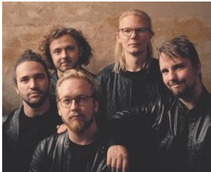
Mads Hansens Kapel er et ungt og kreativt pust over den danske folkemusik, som har fundet sammen om en fælles kærlighed til den danske traditionsmusik. Kendt for deres fornyelse af denne og for deres gode dansemusik.