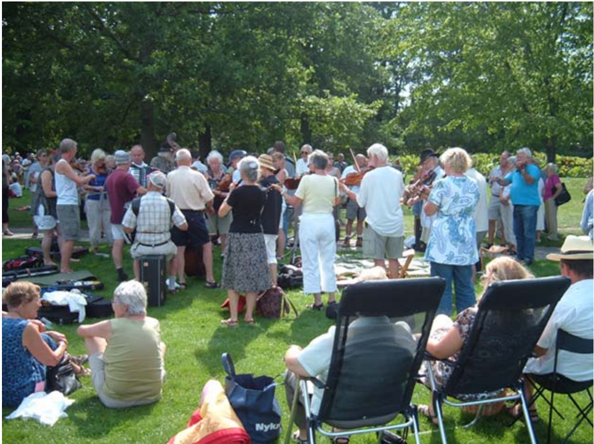
Stævnesøndagen blev sidst afholdt i Folkeparken i 2009.

Folkeparkens dejlige grønne rammer, til glæde for både musikere, dansere og tilhørere. Skulle det regne, bliver Kildegårdshallen rammen om søndagens program. Stævnegruppen